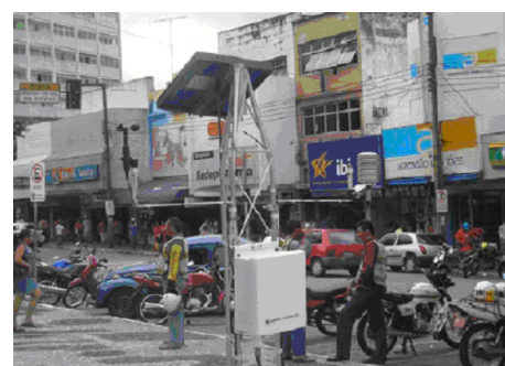
Experimento Meteorológico clima urbano – Campina Grande - PB