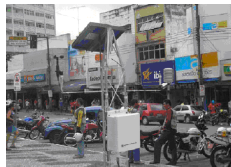
Experimento Meteorológico clima urbano – Campina Grande - PB