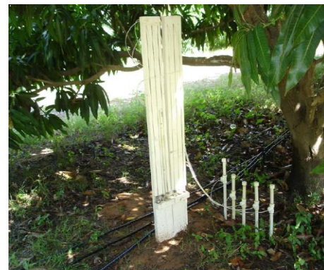
Experimento Agrometeorológico pomar de mangueira - área irrigada de Petrolina - PE

As necessidades hídricas de culturas de interesse regional têm sido estudadas em experimentos de campo conduzidos em diferentes perímetros irrigados na região Nordeste do Brasil.