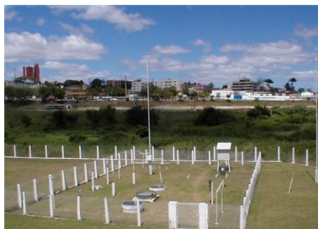
Observatório Meteorológico - UFCG Estações convencional e automática