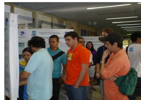
Graduação em Meteorologia Iniciação Científica - PIBIC/CNPq